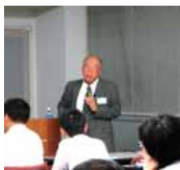
加賀谷教授特別講演