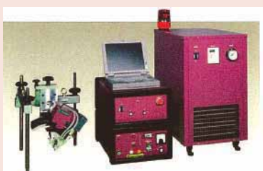
写真1 可搬型X線応力測定装置

現地でしか応力測定出来ない場所でも測定が可能です。金属部品の加工、溶接によって発生する残留応力は、その大きさによっては割れの原因となります。この対策として、ショットピーニングや応力除去熱処理等が施されます。ショットピーニングを施した後、電解研磨で 10\mu\text{m} ずつ研磨して、応力測定することにより、深さ 0\sim 500\mu\text{m} に圧縮応力が付加されることが確認出来ます(図1)。このような処理後の応力調査を現地に測定装置を移動させ、測定を行う事が可能です(写真1,2)。