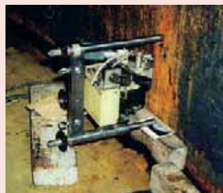
写真2 タンク内部の応力測定状況