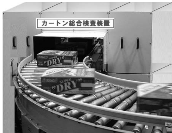
写真1 短辺カートン検査装置概観