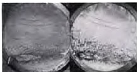
【写真1】錆除去前後の破面比較