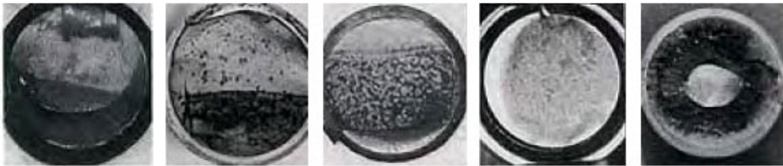
a 片振引張疲労 b 片振平面曲げ疲労 c 両振平面曲げ疲労 d 回転曲げ疲労 e ねじり疲労