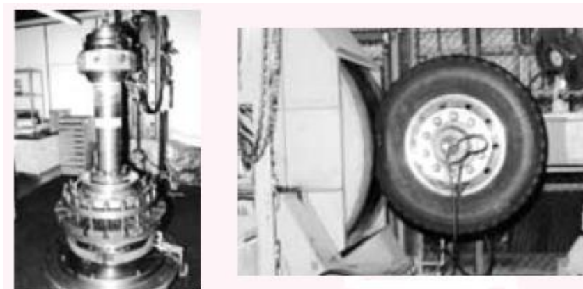
写真3 ホイール曲げモーメント耐久試験機

ホイールの強度試験として、曲げモーメント耐久試験機とドラム耐久試験機を保有しています（写真3、4）。